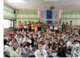
บรรยายให้ความรู้เรื่องยาเสพติดแก่นักเรียน