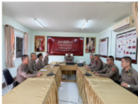
ประชุมการปฏิบัติงานสอบสวนและกฎหมายคดีออนไลน์