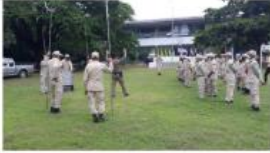
อบรมให้ความรู้ตามโครงการ ทบทวนประสิทธิภาพ อปพร.