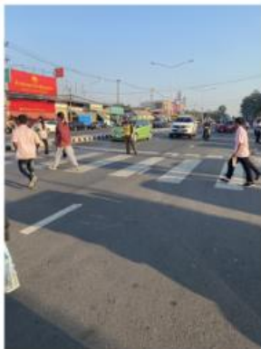
การอำนวยความสะดวกด้านการจราจร และการเข้า ทางของประชาชน