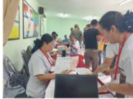
การตรวจสอบสภาพประจำปีให้แก่ข้าราชการตำรวจและลูกจ้างประจำ ของ สภ.จังหวัด ประจําปี 2567