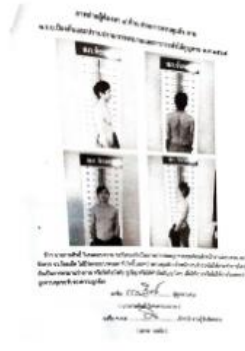
การจับกุมผู้ต้องหาตลอดครองเสพยาเสพติด ตามโครงการร้อยเอ็ดโมเดล