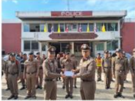
มอบทุนสวัสดิการอาหารกลางวันให้แก่ข้าราชการตำรวจ