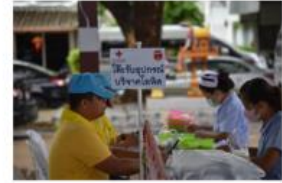
กิจกรรมจิตอาสาทำความดีด้วยหัวใจด้วยการบริจาคโลหิต