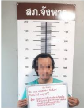
การจับกุมผู้ต้องหาตลอดครองเสพยาเสพติด ตามโครงการร้อยเอ็ดโมเดล