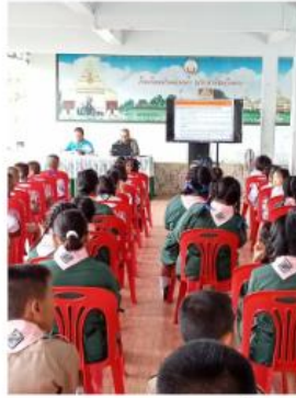
การดำเนินโครงการป้องกันปราบปรามสื่อลามก และ การส่งเสริมจิตทางเพศในสถานศึกษา